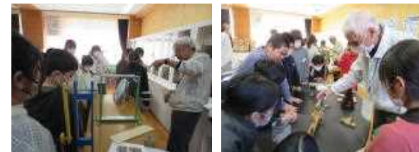
楽しい!理科おじさんとの授業

12月13日(水)に、日立理科クラブのみなさんによる支援授業が行われました。今回は5年生理科「ふりこ」の学習です。工夫された実験用具やふりこを活かしたおもちゃにより、ふりこのしくみ等について楽しく学び、理解を深めました。